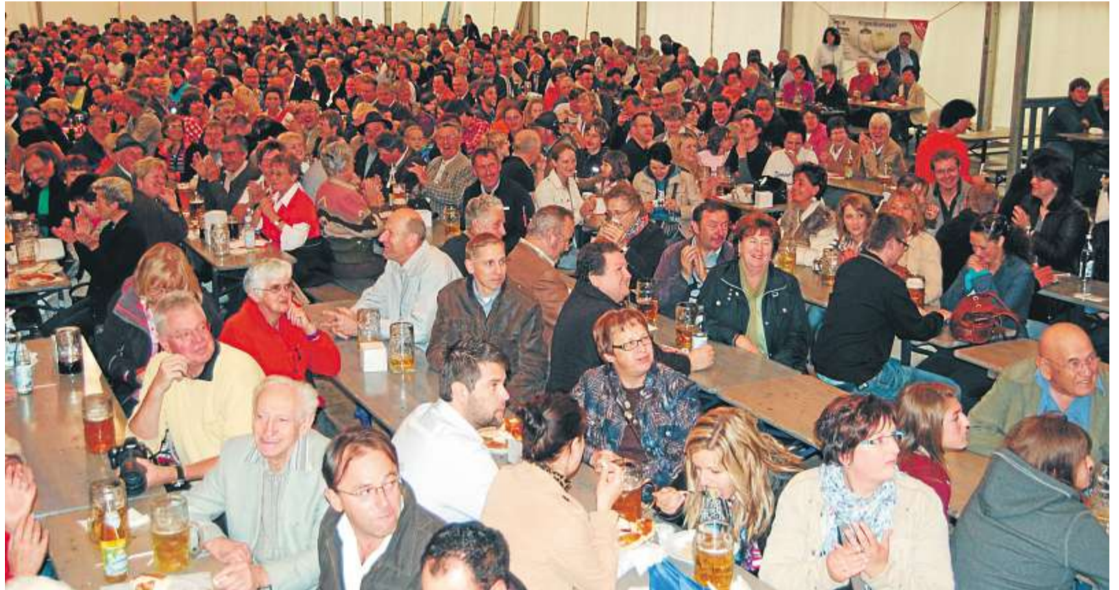
Das Festzelt war voll an diesem Sonntagabend, die Zuschauer waren begeistert und spendeten immer wieder Beifall.

RODING SEITE 21-27 WÖRTH SEITE 28 NITTENAU SEITE 29 WIR IM BAYERWALD SEITE 30 LANDKREIS SEITE 31-33 BAD KÖTZTING SEITE 34 FURTH IM WALD SEITE 35 RÖTZ SEITE 36-37 SPORT IN DER REGION SEITE 46-48 WAS, WANN, WO SEITE 55 STRAUBING SEITE 56 REGENSBURG SEITE 57