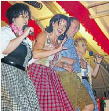
Heimische Models präsentieren Mode im Festzelt.

Mit einem weiteren Höhepunkt wartet am heutigen Dienstag das Rodinger Volksfest auf. Im Festzelt sind bei freiem Eintritt Show und Mode Trumpf. Bereits ab 19.30 Uhr werden die Gruppen des Tanz-Clubs Rot-Weiß Roding mit ihren Vorführungen aufwarten, ab 20.30 Uhr zeigen Dressman und Mannequins aus Roding tragbare Mode für jedes Alter, angefangen von Kindern über Jugendliche bis hin zu Erwachsenen. Beteiligt sind dabei ausschließlich Rodinger Firmen, die zeigen, dass auch hier gut und preiswert eingekauft werden kann. Veranstalter ist die Werbegemeinschaft Schaufenster Roding. Außerdem ist am heutigen Dienstag der Tag der Vereine und Hilfsorganisationen sowie der Tag der Urlaubsgäste. Für die musikalische Unterhaltung im Festzelt sorgt das Duo „Magic“. (pm)